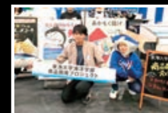
産業フェアイベントへの出展