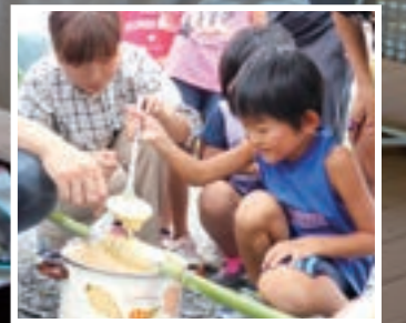
竹を使用したバウムクーヘン作り

東日本大震災の発生から12年以上が経過した東北の被災地では、新たな復興支援活動の在り方が模索されています。本プロジェクトでは岩手、宮城、そして福島でさまざまな復興支援活動を行っています。また、震災の風化防止や防災啓発にも取り組み、震災の記憶や防災の大切さを伝える活動も行っています。被災地で私たちは何ができるのかを考え、新たな取り組みにも挑戦しています。皆さんも被災地の復興支援や震災の風化防止、防災啓発に取り組んでみませんか？