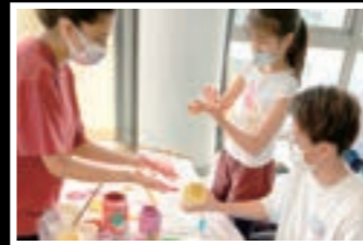
絵を通じた交流活動