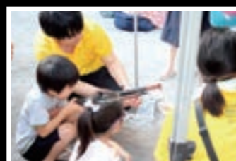
地域イベントへの協力