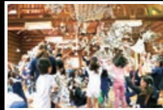
新聞びりびりミュージックゲーム