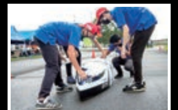
電気自動車レース参戦