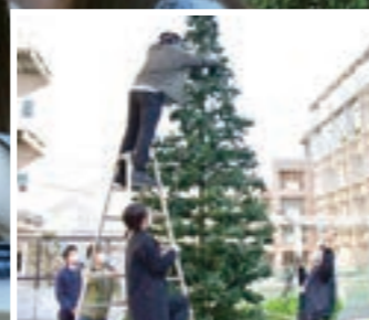
クリスマスツリーの設置