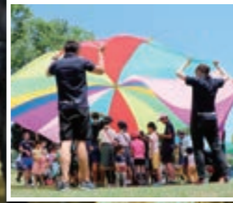
パラバルーンゲーム

私たちは、「スポーツを通じて地域のQOLを向上させる」を活動理念とし、スポーツを通じて地域のお年寄りや子どもたちと交流を深めることを目的としたさまざまな活動を行っています。スポーツイベントでは一から企画運営を行っています。活動をして一番うれしいことは、参加してくれた人たちの楽しんでいる姿や笑顔を見れることです。スポーツが好きの方、人と関わることが好きな方、企画運営に挑戦したい方、ぜひ私たちと一緒に地域に笑顔を届ける活動をしてみませんか？