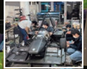
ものづくり館での車両調整

私たちは毎年フォーミュラカーを製作し、学生フォーミュラ日本大会に参戦しているプロジェクトです。学生中心に設計・製作・走行を実施しています。文系学部在籍するメンバーも活動しており、理系に限らずメンバーを募集しています。広報活動や会計管理など、製作作業以外の活動も充実しておりますので、興味のある方はお問い合わせください。