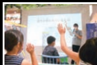
光るスライム工作教室