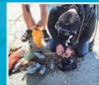
海中ゴミの分別作業