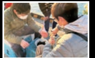
現地調査で漁業のお手伝い