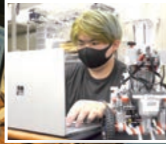
ETロボのプログラミング

私たち先端技術コミュニティACOTは、情報系の分野を中心に先端技術や知識を身につけ、社会貢献を行うプロジェクトです。活動内容としては、ETロボコンというロボットを用いたプログラミング競技への参加、地域の科学イベント等でのロボットプログラミング教室、熊本県警や他大学と共同で行うサイバー防犯ボランティア、ドローンを用いたの空撮活動等を行っています。興味がある方は一緒に活動してみませんか？