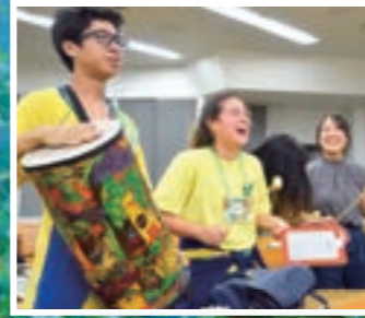
諸外国の伝統的楽器を用いた演奏交流会

子どもたちにとって、「良い」影響を与えられるような企画・活動を実施することで、子どもたちの視野を広げていくことを目的とするプロジェクトです。昨年は大学内でブラジルのお祭り「フェスタジュニーナ」や「イースター」などの企画を実施し、子どもたちと一緒に楽しみました。今年は大規模な交流キャンプイベント「マルチカルチャーキャンプ」を予定しています。子どもが好きな方、英語や外国に興味のある方、そうでない方も、みなさんぜひご参加ください。