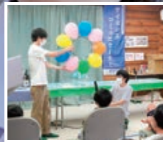
空気の実験ショー

私たちは、近年課題となっている理科離れを防ぐ目的で活動しており、近隣の公民館や大学内で科学工作教室、実験ショーを行っているプロジェクトです。子どもたちが楽しみながら、理科に興味を持ってもらえるような企画を提案・実施しています。活動を通して小学校低学年の子どもたちとの交流が体験できるというのも魅力の一つです。本プロジェクトは理系の学生だけでなく、文系の学生も参加しているので興味のある方はお気軽にご連絡ください。