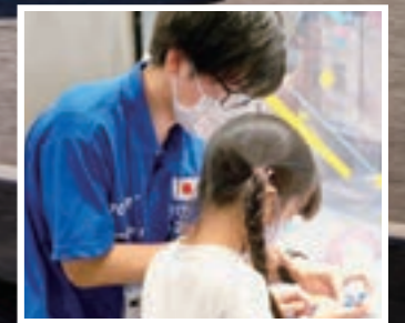
ペットボトルソーラーカー工作教室

私たちはソーラーカー・電気自動車を設計・製作し国内外の大会に参戦しています。チームの目標は2年に一度オーストラリアで開催される世界最高峰のソーラーカーレース「Bridgestone World Solar Challenge」で総合優勝を獲得することです。設計から製作まで学生が一から手掛けていきます。ソーラーカーの開発を通してカーボンニュートラル社会の実現に向けた最先端の技術開発ができることが特徴です。共に世界一を目指して頑張しましょう。