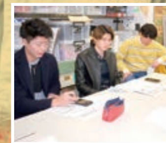
商品開発企画会議