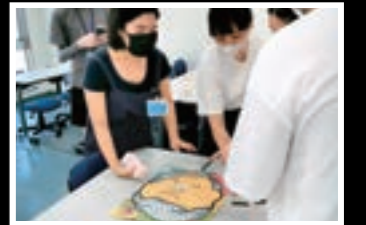
福笑い企画を通じた留学生との交流