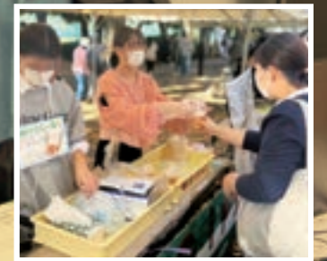
産学官連携によるメロンジュースの販売

GIPは近年注目を集めている「SDGs」に取り組む団体です。GIP内にはアートやモノづくり、プラスチック削減、地域活性化、食品関連などさまざまな角度からSDGs達成に向けたミニプロジェクトが立ち上がっています。自分のやりたいこと、挑戦したいことをプロジェクトとして立ち上げ、メンバーと共に協力することができる環境が整っています。既存のミニプロジェクトに参加することも大歓迎。プロジェクト活動を楽しみ、豊かな大学生活と一緒に送りたいませんか？