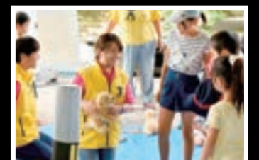
動物愛護啓発活動