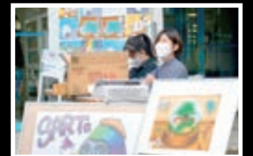
アートを用いたSDGs普及活動