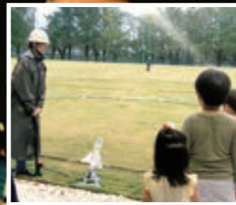
ペットボトルロケット発射①

私たちは「イノベーション人材の育成」をテーマに、ロボットやIT技術に触れることでデジタル技術を育成する「STEM教育」に関するイベントを主催している団体です。昨年度は、今のものづくりの人材に必要な「挑戦と高信頼性の両立」を養う場として、プログラミングイベント「IWRC」を開催。各種センサとマイクロコンピュータを搭載したペットボトルロケットの開発、打ち上げを行いました。イベント企画、運営、告知、広報など、メンバーと協力しながら活動しています。みなさんもこれまでの人生で体験したことのないようなやりがいと達成感を感じてみませんか？メンバー一同よりお待ちしております。