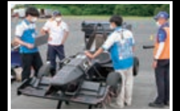
フォーミュラ大会での車検