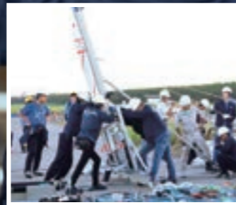
機体打ち上げ準備

私たちのプロジェクトは、一からロケットの設計を行い、製作、実験を通してロケットの打ち上げを目指すプロジェクトです。設計から自分たちで行うため、ロケットの構造や原理などをより詳しく学べます。また、CADの操作方法や実際の部品の製作などを先輩から丁寧に教えてもらえます。宇宙や飛行機が好きな方はもちろん、少しでも興味があるという方も大歓迎です。ぜひ一緒にロケットの打ち上げを成功させて、最高の思い出を作りましょう。