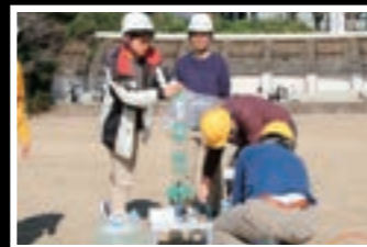
ペットボトルロケット発射②